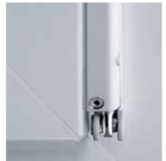
Flügellager mit Anpressdruckverstellung