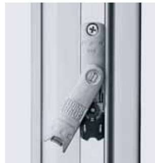
Trio-Funktionselement mit integrierter Fehlschaltssicherung, Flügelheber und Balkontürschnapper