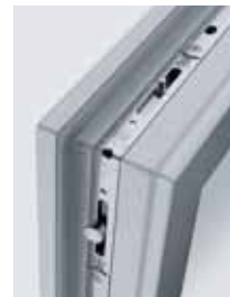
Drei baugleiche Eckumlenkungen an einem Drehkipplügel möglich