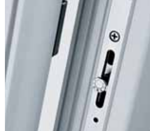
Ein Verschlusspunkt für alle Bauteile und Sicherheitsstufen