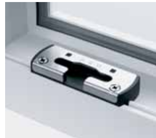
Sicherheitskippschließblech rechts/links verwendbar