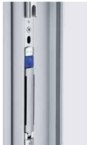
Stulpflügelgetriebe mit markanter Einstiegstaste für hohen Bedienkomfort