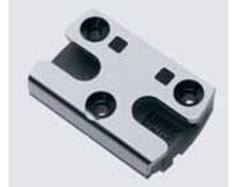
Verschiedene Sicherheitsstufen auf einer Plattform